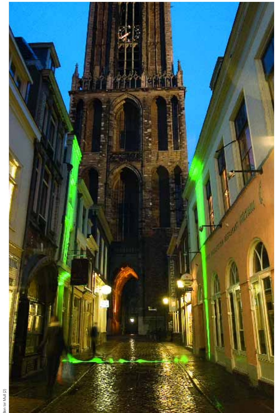
Ben ter Mool (2)